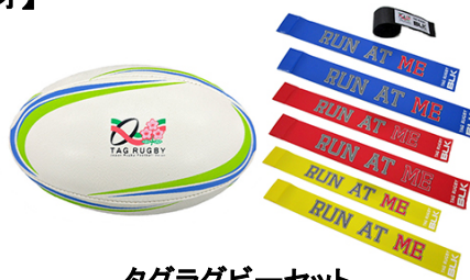
タグラグビーセット （60 団体：対象は小学生以下）