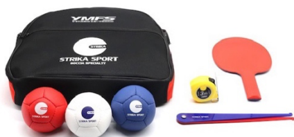
ポッチャボールセット （60 団体：対象は小・中学生）