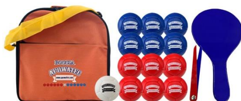
ポッチャボールセット (60 団体:対象は中学生以下)