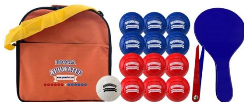
ポッチャボールセット (60 団体:対象は中学生以下)