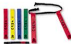
タグラグビーセット (60 団体:対象は小学生以下)