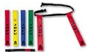
タグラグビーセット (60団体:対象は小学生以下)