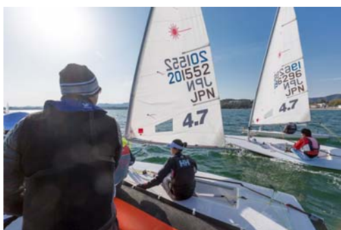
レースが終わった後も、有志の選手によるスピード練習が行われた