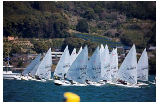
世界選手権の選考対象レースとなったレーザー4.7級