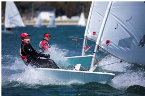
10m/sを越すブローが吹き荒れた大会初日