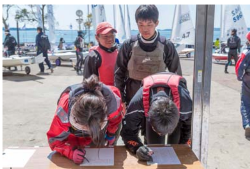
湖面に出る前には必ず出艇申告をする。ヨットレースの絶対的なルール