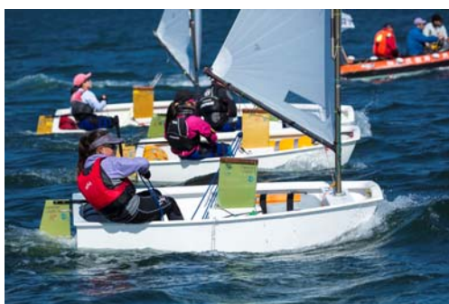
レベルの高い選手が集まり大接戦となったOP級上級