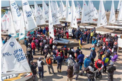
レーザー4.7級の艇体を使いながら、ジャッジによる42条の講義も行われた