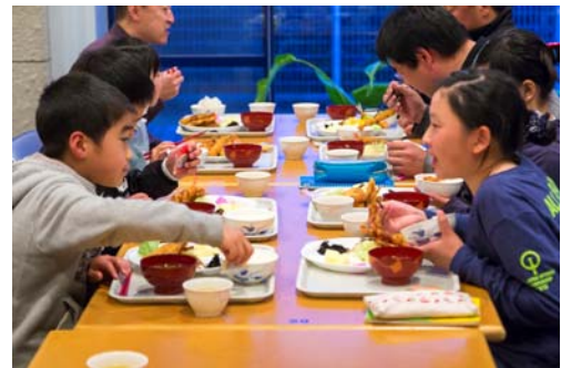
三ヶ日青年の家での夕食。全国の友だちと語り合う夜