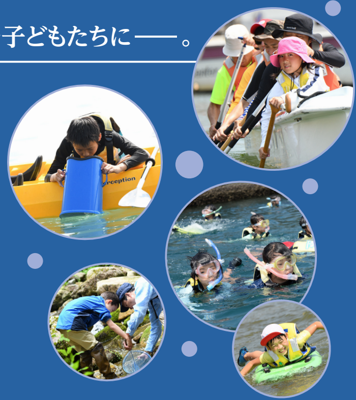
※水辺とは河川、湖沼、池、湿原、海、砂浜、岩場、干潟など水面に近接した場所をさします

「全国児童水辺の風景画コンテスト」は、子どもたちが海や水辺に出かけた時の「びっくりするような発見」や「思い出に残る貴重な体験」からさまざまなことを学び、逞しく成長することを願って毎年実施しています。 近年、自然とふれあう機会が減少していると言われていますが、当コンテストをきっかけに水辺へ出かけ、自然とふれあい、体験した出来事を思い出しながら絵に表現してみませんか？ 子どもらしく素直な感性・視点で生き生きと描かれた作品を心よりお待ちしております。