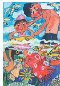
「うみっておもしろい」