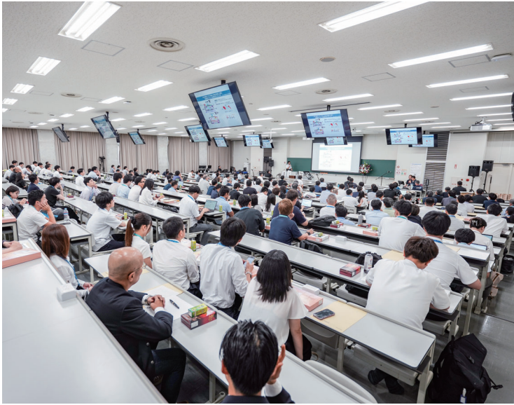
助成事業の認知・理解をひろげるため、学会大会でランチョンセミナーを開催