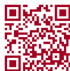
ブレード ランニングクリニック