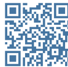
ユニバーサル かけっこチャレンジ