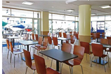
<キャプテンズルーム>