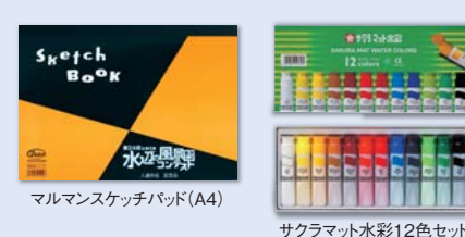
マルマンスケッチブック(A4)