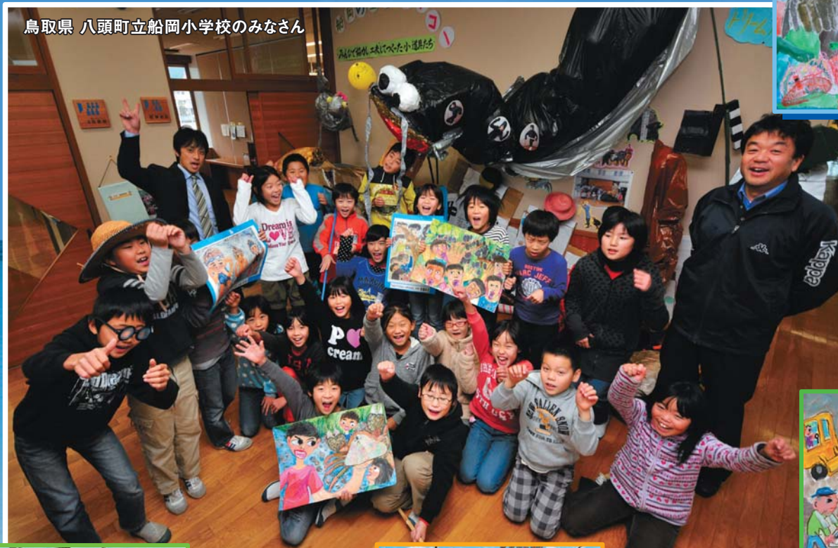
鳥取県 八頭町立船岡小学校のみなさん