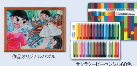
作品オリジナルバスル